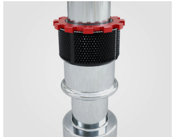
EASYdoff: reemplazable, diseño moderno adecuado para cualquier tipo de máquina