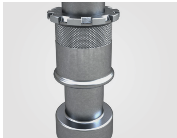
Cortador de acero: corona de captura y corte adecuada para cualquier tipo de máquina