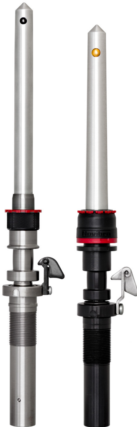
NASA HPS 68 con EASYdoff