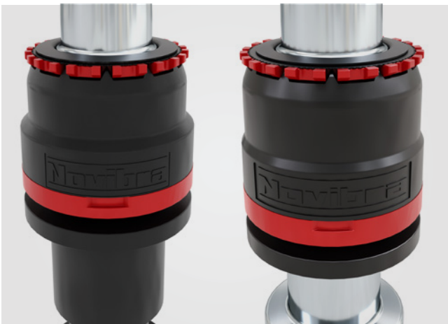
CROCOdoff y CROCOdoff Forte: reemplazable, mudada auténtica sin extraplegado, con autolimpieza, adecuado para cualquier tipo de máquina

La versatilidad de la cartera de Novibra también se refleja en la amplia gama de coronas de huso. Desde las coronas de captura y corte, basadas en el conocido sistema de tres extraplegados, hasta las modernas coronas de mordaza, con la ventaja de un menor mantenimiento y limpieza. Novibra ofrece varios diseños de coronas que van desde el moderno EASYdoff hasta las robustas coronas de acero y desde el SERVOgrip hasta el CROCOdoff con autolimpieza.