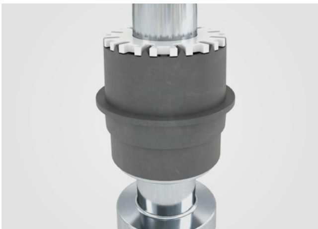
SERVOgrip: reemplazable, mudada auténtica sin extraplegado, exclusivo para máquinas de hilar a anillos de Rieter