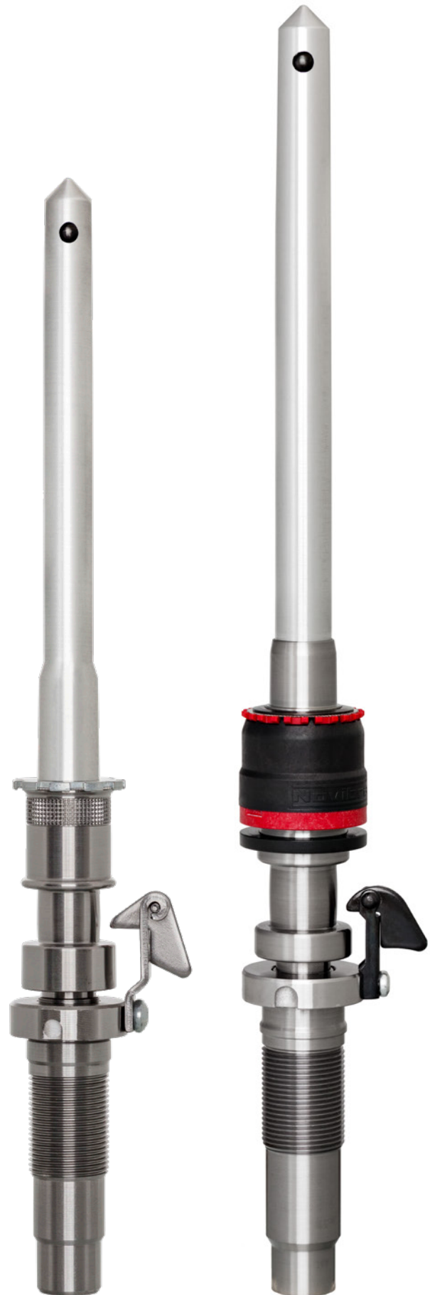
HPS 68 con cortador de acero