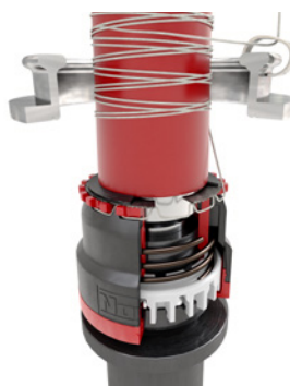
Установлена пустая трубка, пряжа зажата, запуск веретена.