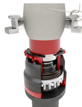
Прядение, пряжа отпущена, конец нити вылетает из системы.