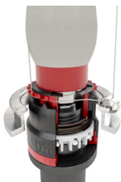
Початок завершен, обратная намотка, пряжа вставлена.