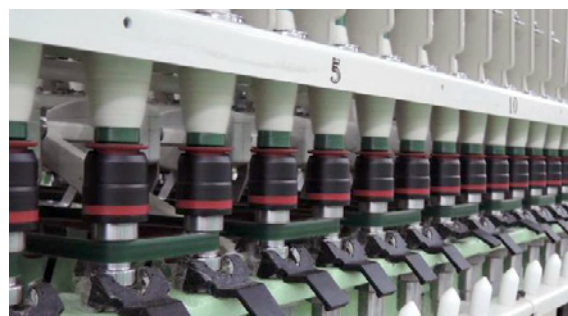
коронки, не требующие подмотки