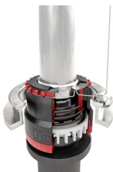
Веретено остановлено, пряжа зажата, початок снят, пряжа обрезана.